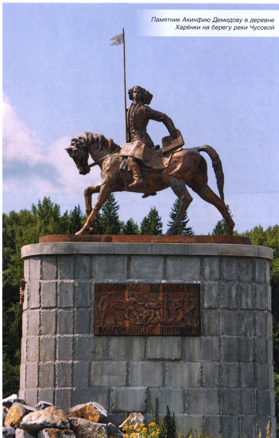
Памятник Акинфию Демидову в деревне Харёнки на берегу реки Чусовой