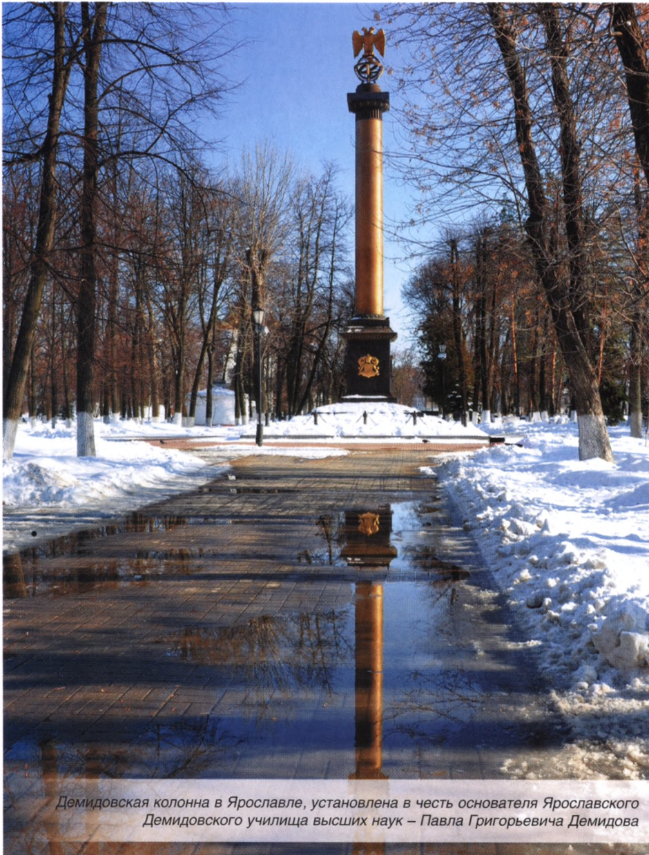
Демидовская колонна в Ярославле, установлена в честь основателя Ярославского Демидовского училища высших наук – Павла Григорьевича Демидова