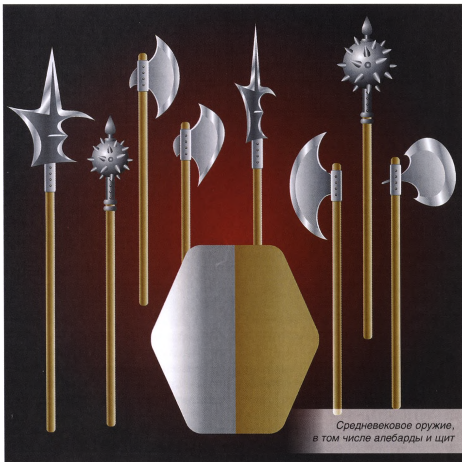
Средневековое оружие, в том числе алебарды и щит