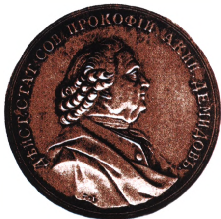
Памятная монета с профилем П. А. Демидова

на, что покупаемые крестьяне часто предпочитали кровопролитные столкновения с правительственными войсками, заставлявшими их подчиниться. Смерть казалась им легким избавлением от жестоких заводчиков.