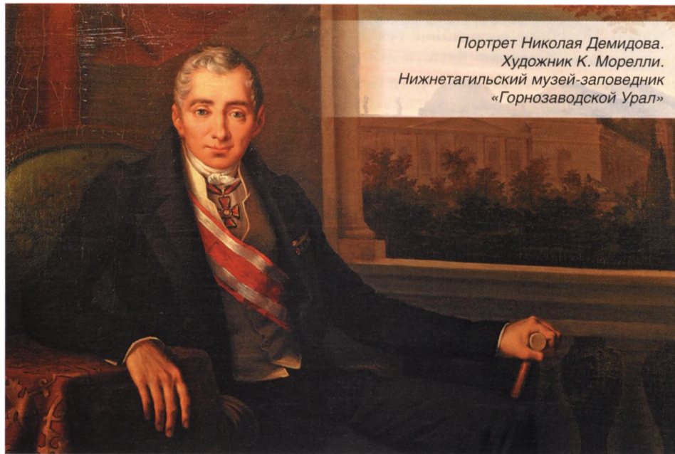
Портрет Николая Демидова. Художник К. Морелли. Нижнетагильский музей-заповедник «Горнозаводской Урал»

Премия исправно выплачивалась достойным россиянам вплоть до Октябрьской революции 1917 года,