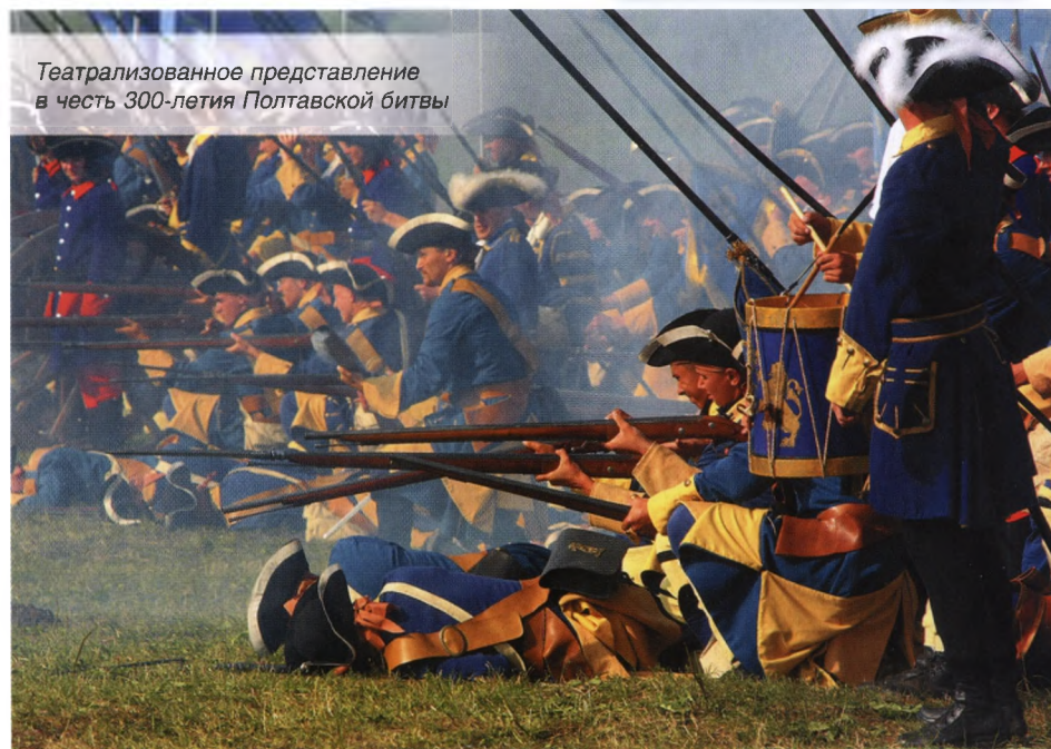
Театрализованное представление в честь 300-летия Полтавской битвы

далекие времена наиболее доходные предприятия на Руси находились в руках правящей элиты.