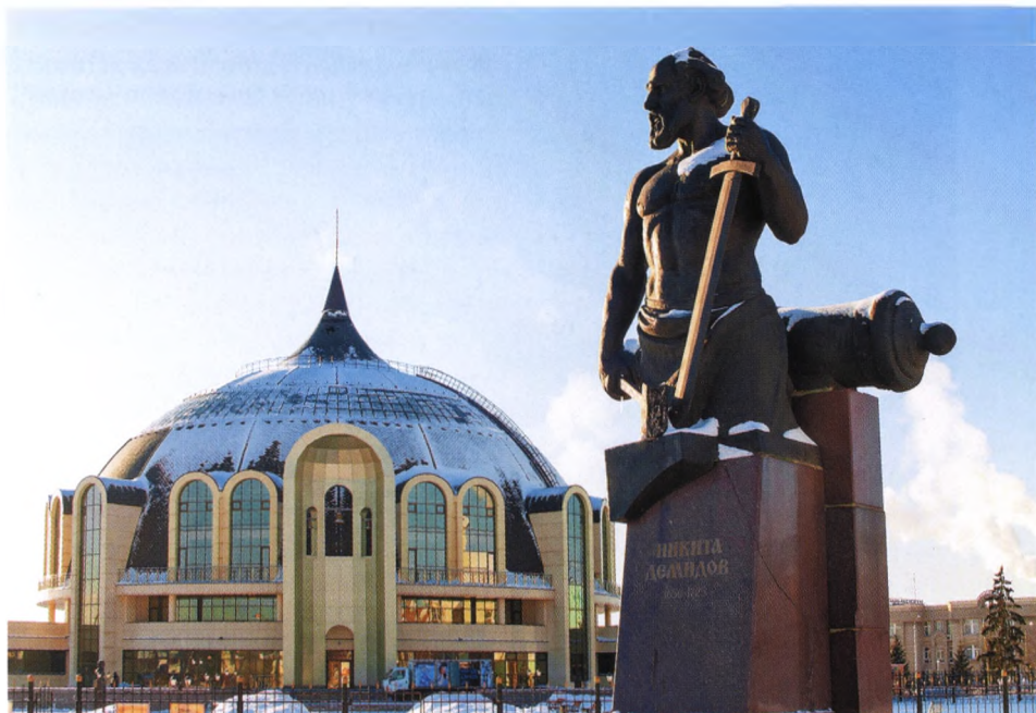
Памятник Никите Демидову на фоне музея оружия в Туле

заводчиком». Евдокиму и Никите, внукам Демидыча Огарков дает крайне уничижительную характеристику: «отличались жестокостью».