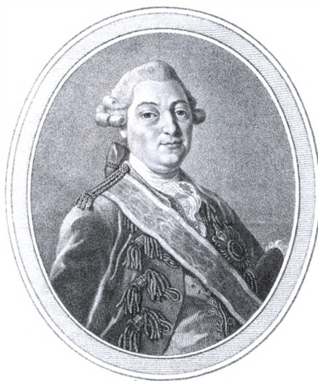
Никита Акинфиевич Демидов. Гравюра работы Г. И. Скородумова (1786)