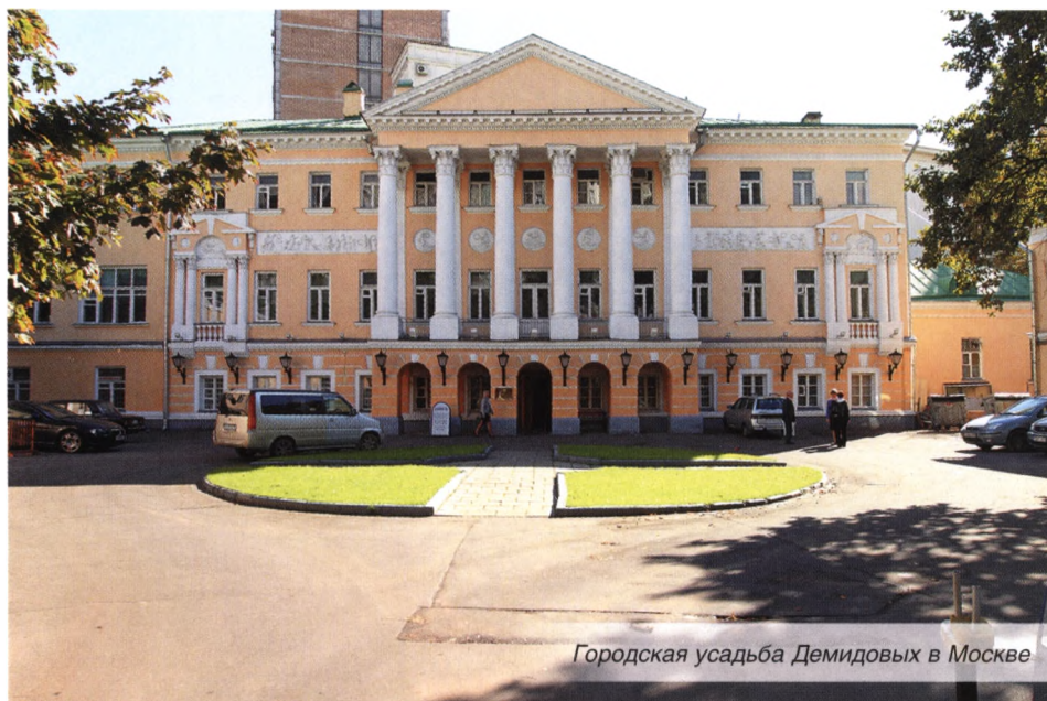
Городская усадьба Демидовых в Москве

Сын Никиты Акинфиевича, Николай (1773–1828), выбрал карьеру военного и дипломата. Русскому престолу он служил в качестве посланника во Флоренции. В свою очередь его