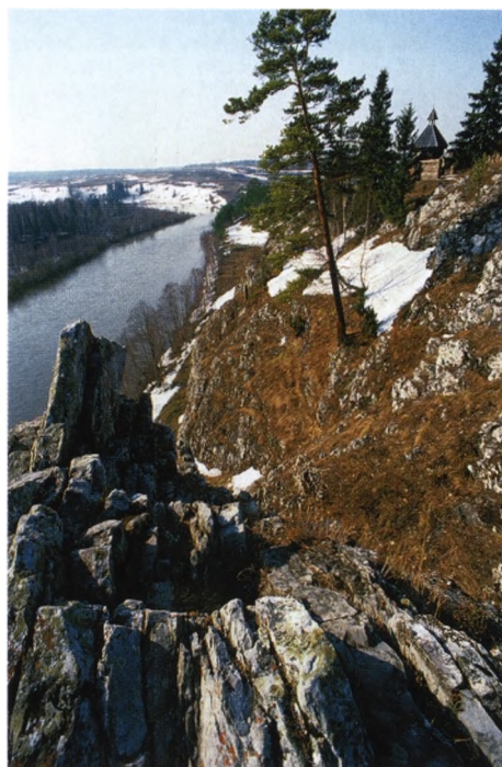
Один из поворотов реки Чусовой

* Всех интересующихся этой темой, мы отправляем к замечательным книгам современного пермского прозаика Алексея Иванова и, в частности, к его романам «Сердце Пармы» и «Золото бунта», в которых он в деталях описал процесс сплава чугуна по Чусовой.