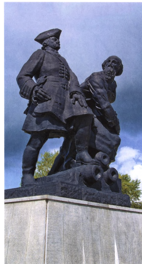
Памятник Петру Великому и Никите Демидову в городе Невьянске

Он тут же приказал отвести Никите в 12 верстах от Тулы, в Малиновой