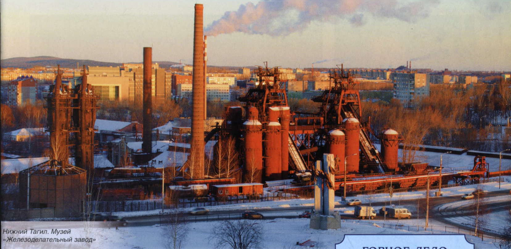
Нижний Тагил. Музей «Железодельный завод»