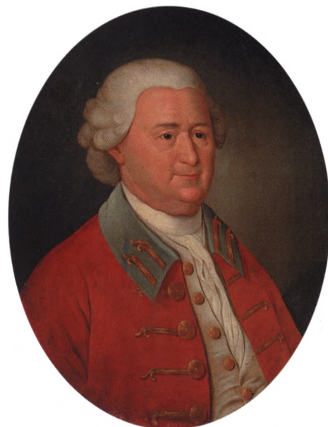
Портрет Прокофия Акинфиевича Демидова кисти неизвестного художника

Говорят, печальная слава о суровом нраве Демидовых витала над российскими селами. Перспектива попасть на заводы была так страш-