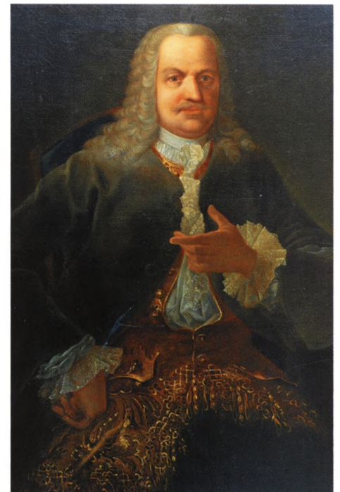
Портрет Акинфия Демидова. Художник Г. К. Гроот. Нижнетагильский музей-заповедник