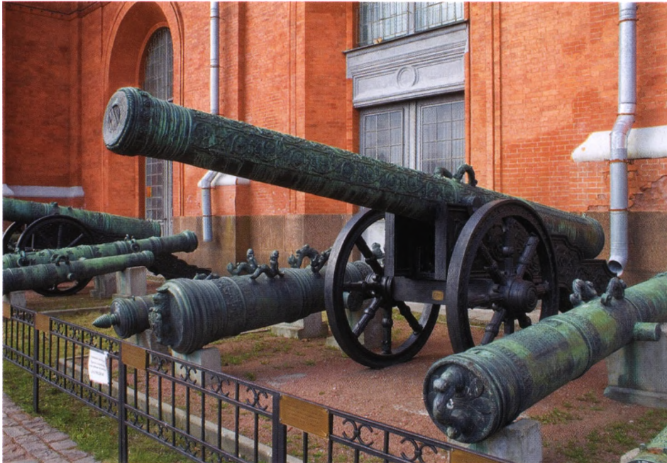
Осадная пицаль «Царь Ахиллес», бронза. Мастер Андрей Чохов (1617)