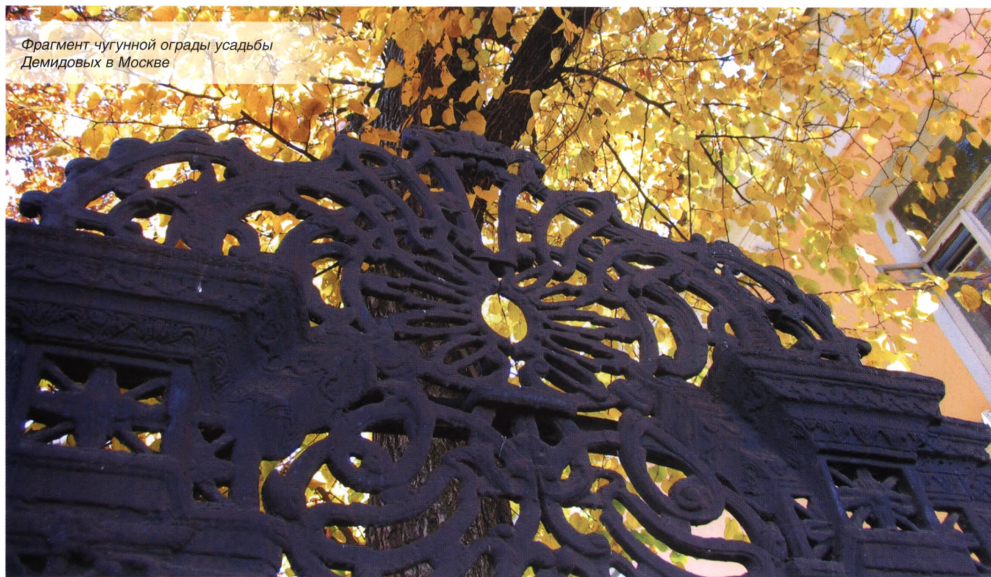
Фрагмент чугунной ограды усадьбы Демидовых в Москве

соответствующий указ. Средства на выплату премий теперь поступают из Общенационального научного негосударственного Демидовского фонда. Каждому лауреату вручается диплом, золотая медаль в уникальном малахитовом футляре-шкатулке и сумма, эквивалентная 15 тысячам долларов. ■