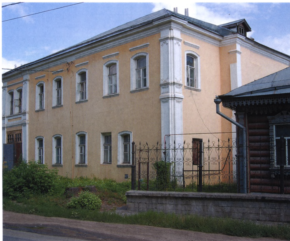
Дом Демидовых в Туле

В течение всей своей деятельности на Урале Никита и Акинфий построили только здесь 10 чугуноплавильных заводов, некоторые из них, как, например, Нижнетагильский, приобрели громкую европейскую извест-