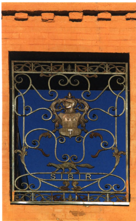
Герб Демидовых. Невьянск

Но царь не оставлял своими милостями Демидыча. В 1709-м Никите было пожаловано личное дворянство, а после смерти Петра Великого указом Екатерины I Демидовы были возведены в потомственные дворяне.