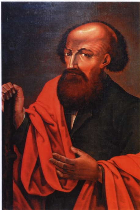
Никита Демидов – основатель династии. Портрет кисти неизвестного художника. Нижнетагильский музей-заповедник «Горнозаводской Урал»

Павшино едва ли не в одном кафтане. В городе ему удалось открыть кузню. (По другой версии, Демид Григорьевич бежал в Тулу из Москвы, спасаясь от рекрутского набора.) Кузнец, однако, скоропостижно скончался, оставив сиротой сына Никиту (1656–1725), которому едва исполнилось восемь лет. Никита Демидович и считается основателем огромного хозяйства и, соответственно, – богатства рода Демидовых.