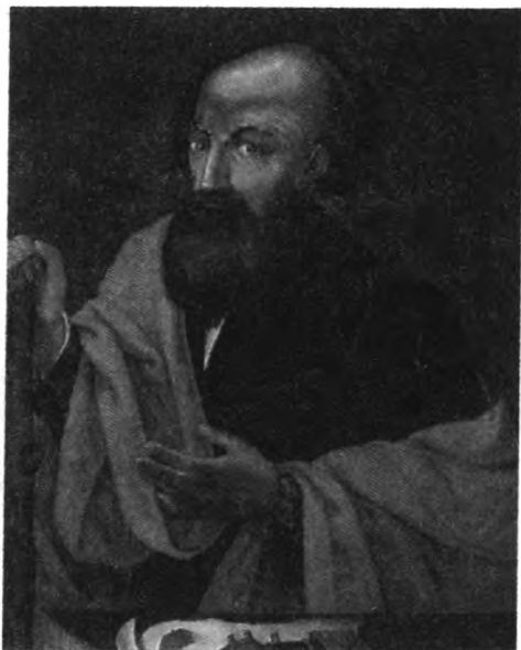
Н. Д. Демидов

Начался новый всплеск предпринимательской активности «тулянина» на Урале и в Сибири. Последнее десятилетие его жизни было очень плодотворным. Он построил четыре новых железных и медных завода на Урале: Быньговский (1718), Выйский (1721), Нижне-Тагильский (1725) и Нижне-Лайский (1726). Один завод был построен им на реке Оке. Еще при жизни Никиты его сыном Акинфием были устроены на Урале Шуралинский (1716) и Верхне-Тагильский железодельные заводы. Получив от Петра земли в Сибири с правом расширять их покупкой новых участков, Никита Демидов и его сыновья построили и здесь несколько железных и медных заводов и положили начало заселению заводскими людьми отдаленных районов Сибири вплоть до глухих Колыванских мест.