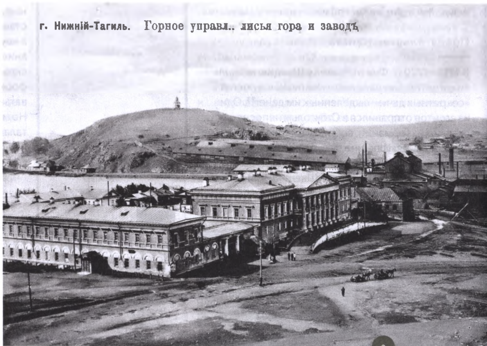
г. Нижний-Тагиль. Горное управл., лисья гора и завод