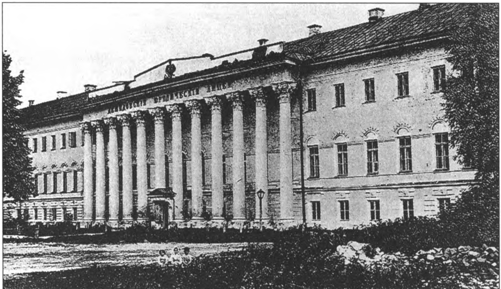
Демидовский юридический лицей