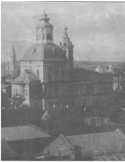
Николо-Зарецкая церковь Фото начала XX века