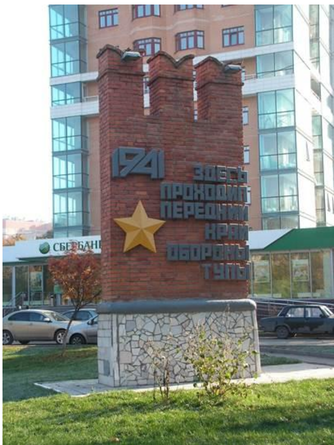
Памятный знак, пр. Ленина, напротив дома 113б

В нашем городе памятные знаки «Передний край обороны Тулы» появились в 1980 году в честь 35-й годовщины Победы советского народа в Великой Отечественной войне.